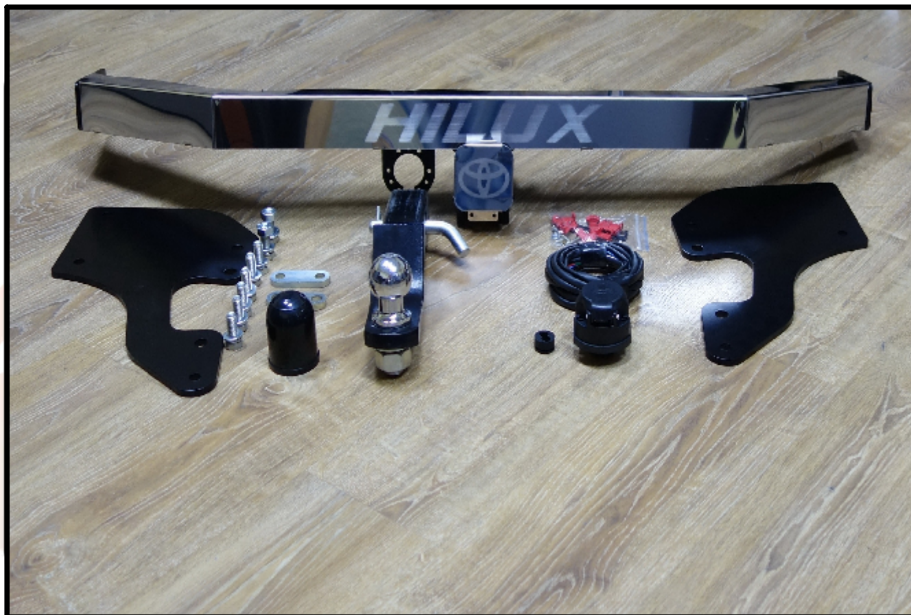
Фаркоп арт. TCU00023 TCU00245 (не оцинкованный)